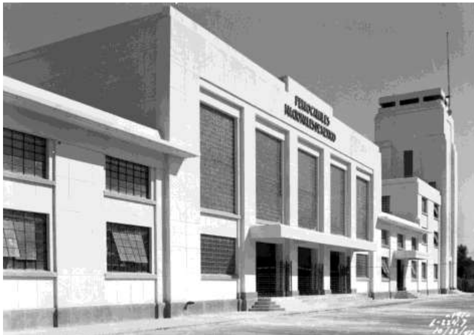
Edificio de la estación de pasajeros en San Luis Potosí, 22 de octubre de 1942.