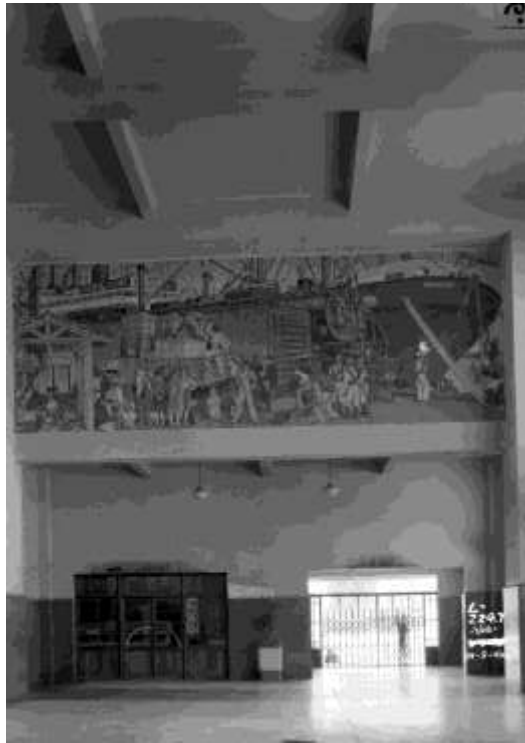
Mural en el interior de la estación de San Luis Potosí, 9 de abril de 1946. Fondo FNM, Sección Comisión de Avalúo e Inventarios. Secretaría de Cultura, CNPPCF, CEDIF.

En el mural llamado “La Edad de la Máquina” se puede observar una escena de descarga en un puerto donde la locomotora contrasta con el barco que se ubica a su costado. Fernando Leal puede ser considerado uno de los pioneros de la pintura mural en México, en sus obras de gran carga social dejó plasmada su visión del impacto de los medios de transporte, en especial el ferrocarril, símbolo de progreso en la sociedad del siglo XX.