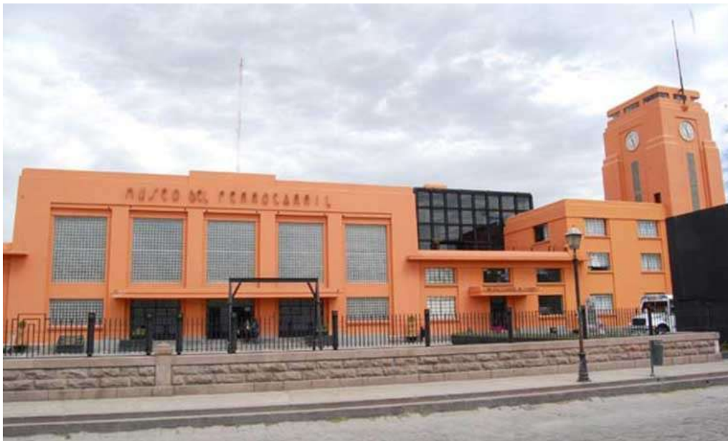
Fachada del ahora Museo del ferrocarril (antigua estación de pasajeros)