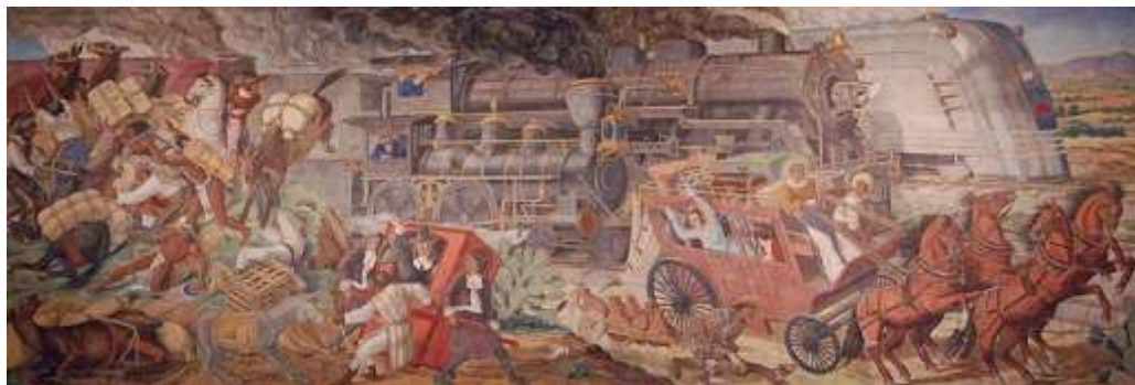
“El triunfo de la locomotora” de Fernando Leal

“El dibujo realista y preciso de Fernando Leal ha cubierto más de 4 metros cuadrados, dimensiones en que los colores, las formas y la equilibrada composición, triunfan con igual donaire, y en parangón con el tema de la obra “El triunfo de la locomotora”. A los dos triunfos hay que agregar uno más; el de los obreros mexicanos de Sindicato de Ferrocarrileros, que han tenido la elogiante iniciativa de ayudar a la cultura artística de México, cooperando en la realización de obras de arte para el pueblo...” 5