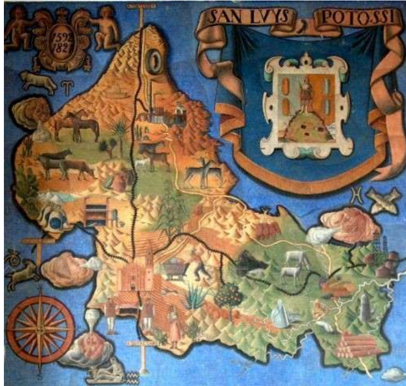
Mural regional del vestíbulo de la antigua estación de pasajeros

Félix Rojas, de motivos regionales expresan el compromiso de un pueblo con el desarrollo de su Estado.