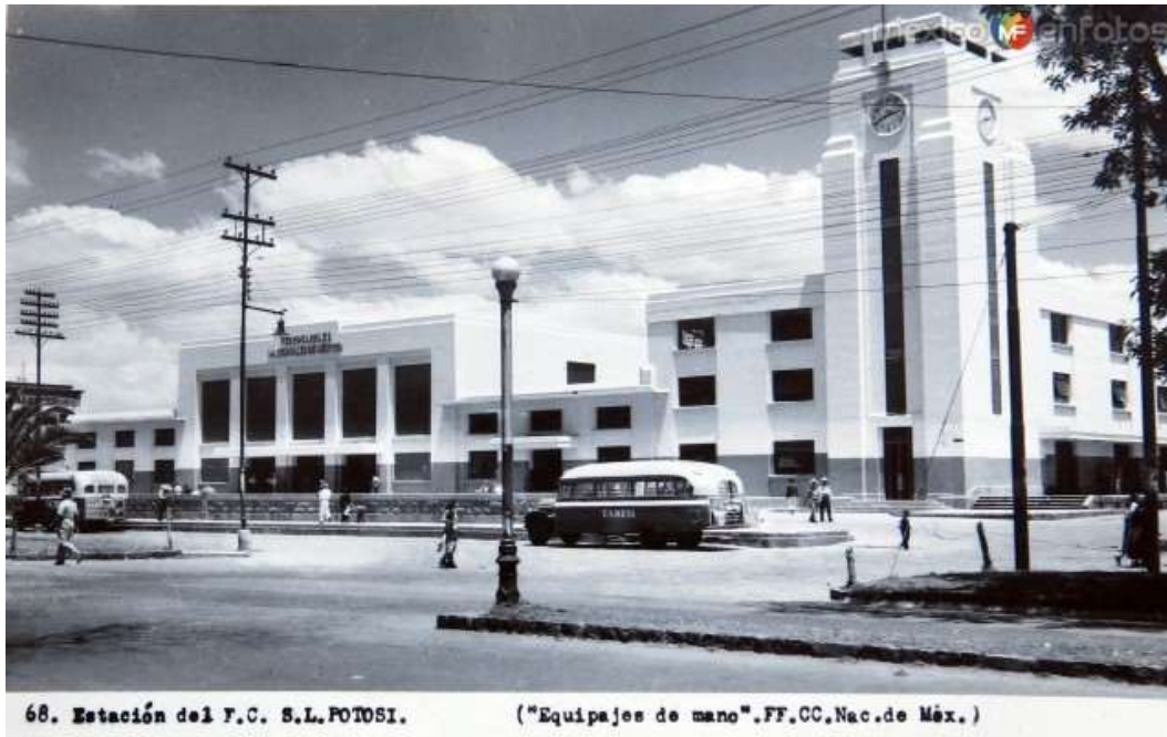
Estación de ferrocarril en 1945, San Luis Potosí, México. 4