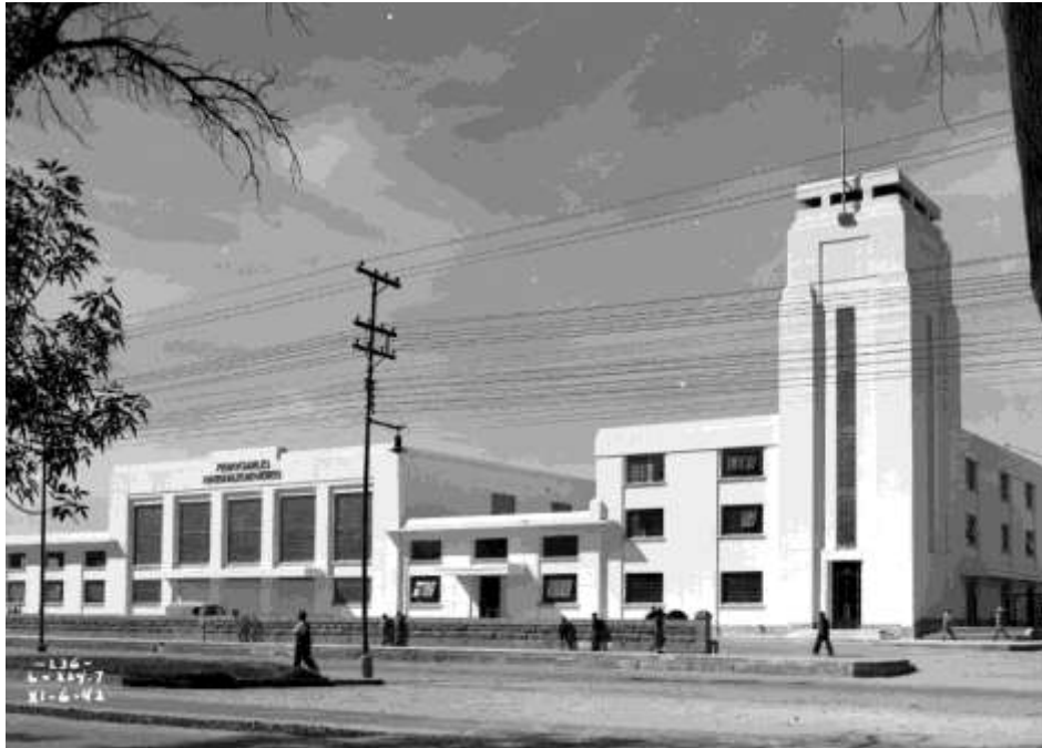
Vista de conjunto de la nueva estación de San Luis Potosí, 6 de noviembre de 1942. Fondo FNM, Sección Comisión de Avalúo e Inventarios. Secretaría de Cultura, CNPPCF, CEDIF.

Dichos volúmenes dan lugar a grandes espacios funcionales como el vestíbulo, salas de espera y arribo, restaurante y en sus anexos oficinas de las Divisiones Cárdenas y San Luis. En el extremo derecho una estructura prismática sobresale de la estación, si seguimos de abajo hacia arriba las líneas que enmarcan cada cara de la torre nos llevan a un reloj en lo alto, de manera que puede ser visto desde diversos puntos de la ciudad, las líneas rectas con ventanas rectangulares sin mayor decoración caracterizan a todo el edificio, que en ese entonces ostentaba un color claro en lugar del color intenso que se aprecia en la actualidad.