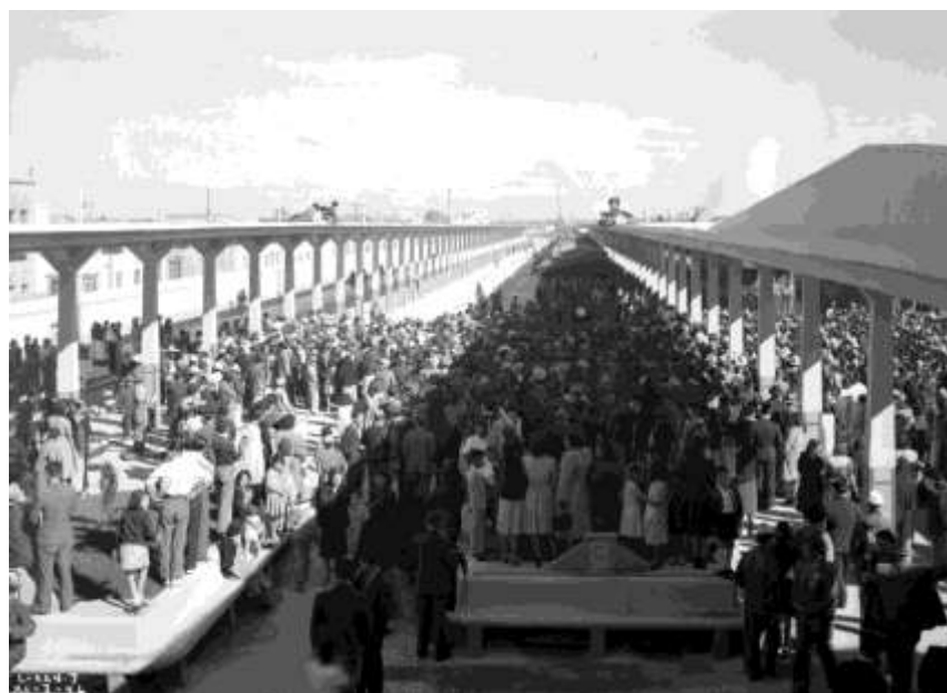
Andenes de la nueva estación de San Luis Potosí, después de la inauguración del edificio, 7 de noviembre de 1942.